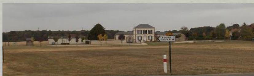
Vue dégagée d'un plateau à Chuelles