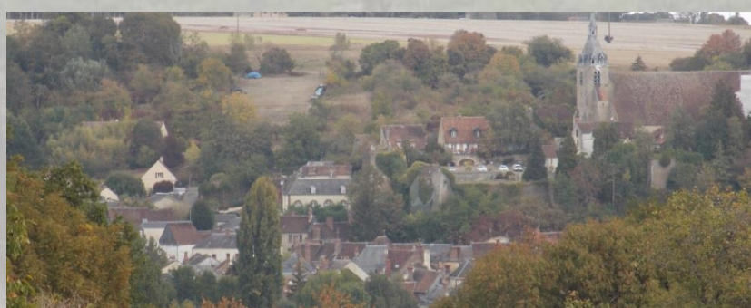
Cône de vue sur le cœur historique de Château-Renard