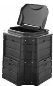
Modèle plastique 400 litres