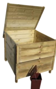
Modèle bois 575 litres